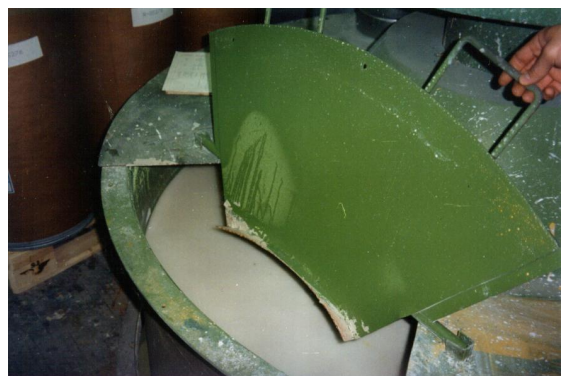
Blandebeholder til maling, belagt med Accopon 2G54

Dette datablad dækker også belægningen Accopon 1G54. Enkelte tekniske data kan være anderledes. (Kontakt Accoat for yderligere information)