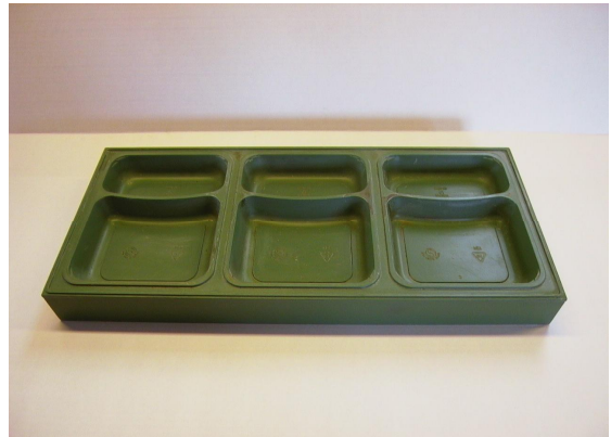
Form til plaststøbning, belagt med Accopon 2G54

Den økonomiske gevinst ved bedre udnyttelse af produktet og besparelse i tid er stor og hertil kommer ofte en stor miljøgevinst, idet mængden af rengøringsmidler f.eks. opløsningsmidler kan reduceres betydeligt.