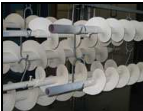
Udstyr belagt med Accolan W98

Vi tilsender gerne prøveplader på de forskellige Accoat belægninger uden beregning. På den måde kan De vurdere om belægningen egner sig til Deres opgave. Kontakt venligst vores salgsafdeling.