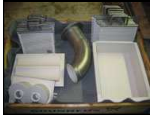
Udstyr belagt med Accolan W98

Accolan W98 er modstandsdygtig overfor de mest anvendte rengøringsmidler i fødevareindustrien.