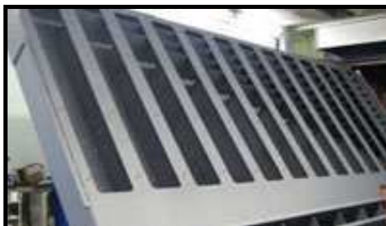
Udsugningskasse belagt med Accolan Silver

Vi tilsender gerne prøveplader på de forskellige Accoat-belægninger uden beregning. På den måde kan De vurdere om belægningen egner sig til Deres opgave. Kontakt venligst vores salgsafdeling.