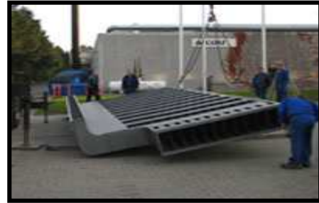
Udsugningskasse belagt med Accolan Silver

På grund af sin alsidighed er Accolan Silver og Accolan S2 også særdeles brugbar ved anvendelse i forbindelse med is/ frosne produkter og frysetørrings-bakker.