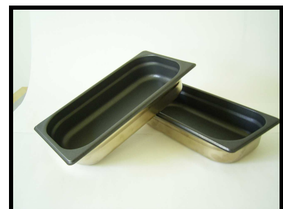
Bageforme belagt med Accoflon 1C

Belægningen findes også i en sort version: Accoflon P697. Bortset fra farven er egenskaberne identiske.