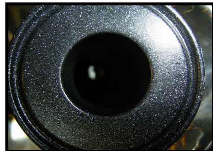
Rørstykke belagt med Accofal 2G54

Dette datablad dækker også belægningerne Accofal 1G54, 3G54 Enkelte tekniske data kan være anderledes. (Kontakt Acccoat's salgsafdeling for yderligere information)