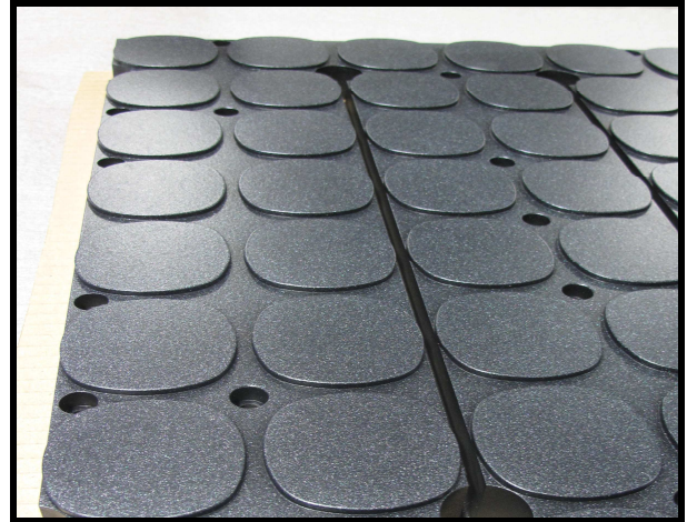
Udstyr til fødevarerindustrien, belagt med Accofal 2G54

På grund af den høje anvendelsestemperatur (op til 260°) kan belægningen også anvendes til plastsvejsning, og på trods af den relativt lave lagtykkelse kan den med fordel også anvendes på emner, der skal beskyttes mod lettere korrosion.