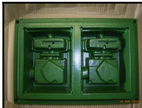
Udstyr belagt med Accolan G (Billede af papæskeform)

Accolan G er specielt egnet til anvendelse i procesudstyr til f.eks. bageplader, gummi- og dækforme, vakuumforme til bl.a. æggebakker, papæsker etc. Accolan G kan med fordel anvendes på skære/svejske emner indenfor medicinsk industri og ikke mindst indenfor farve-, lak- og lim industrien i fyldekar, blandekar og lignende.