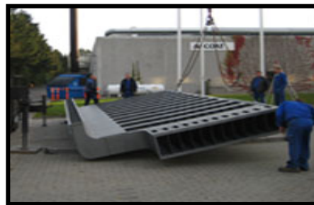
Udsugningskasse belagt med Accolan Silver

På grund af sin alsidighed er Accolan Silver og Accolan S2 også særdeles brugbar ved anvendelse i forbindelse med is/ frosne produkter og frysetørrings-bakker.