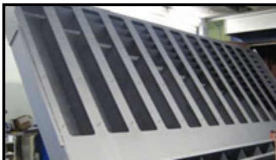
Udsugningskasse belagt med Accolan Silver

Vi tilsender gerne prøveplader på de forskellige Accoat-belægninger uden beregning. På den måde kan De vurdere om belægningen egner sig til Deres opgave. Kontakt venligst vores salgsafdeling.