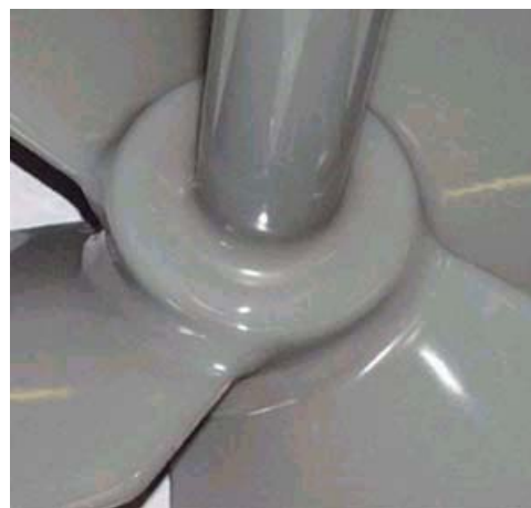
Mixer til kemisk industri, belagt med Accotron