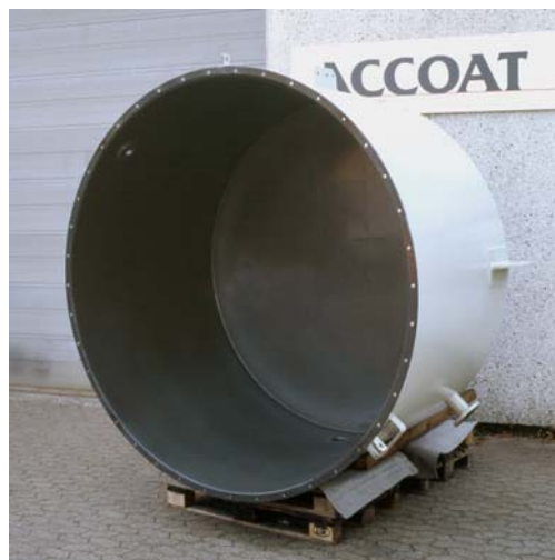
Tank til opbevaring af svovlsyre Indvendigt belagt med Accotron

Belægningen påføres normalt i en lagtykkelse på mellem ½-1mm, og fremstår mørkgrønlig.