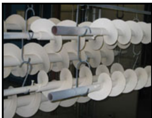
Udstyr belagt med Accolan W98

Vi tilsender gerne prøveplader på de forskellige Accoat belægninger uden beregning. På den måde kan De vurdere om belægningen egner sig til Deres opgave. Kontakt venligst vores salgsafdeling.