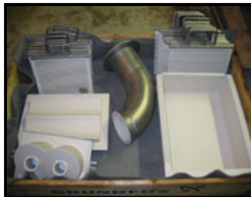
Udstyr belagt med Accolan W98

Accolan W98 er modstandsdygtig overfor de mest anvendte rengøringsmidler i fødevarerindustrien.