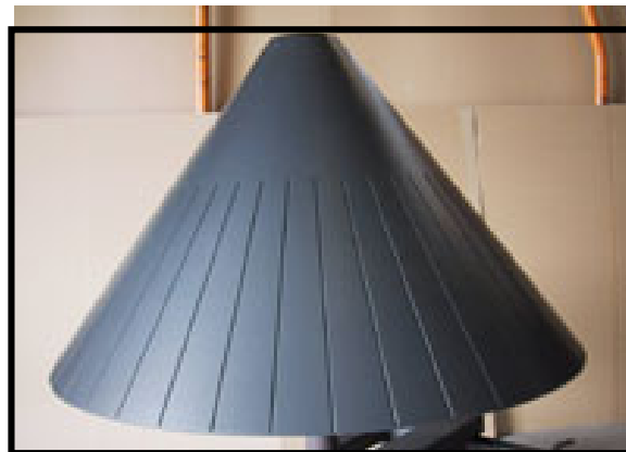
Konus belagt med Accoflon H

Accoflon H er en de senere års største nyheder p.g.a. sin fremragende slidstyrke. Slidstyrken har tidligere været et problem, som har medført kort levetid og dermed forøgede omkostninger og ekstra arbejde. Det er nu med Accoflon H fortid. Belægningen anvendes derfor, hvor man ønsker god slidbestandighed kombineret med de sædvanlige Teflon® egenskaber for fluorcarbonbelægninger, nemlig non-stick eller lav friktions egenskaber. Anvendelserne er mangfoldige: F.eks. plastsvejse udstyr, udstyr til fødevarerproduktion, udstyr til emne transport.